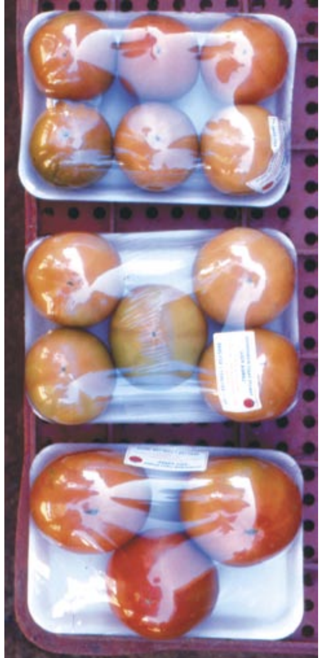
Fig. 8. Tomates produzidos em ambiente protegido com a aplicação do manejo integrado da traça-do-tomateiro.

O controle biológico com T. pretiosum e B. thuringiensis tem assegurado controle eficiente e com menor custo (Figura 8). As taxas de parasitismo oscilam entre 20% e 45% e a redução dos gastos com a aplicação de inseticidas pode alcançar 80%. Assim, para o controle satisfatório da traça é fundamental empregar também as medidas recomendadas em práticas culturais. A principal dificuldade do controle biológico ainda é a falta de laboratórios capacitados para criar e vender o T. pretiosum . Todavia, já existem empresas especializadas que criam e comercializam este parasitóide, tais como: BUG AGENTES BIOLÓGICOS, em Piracicaba - SP e MEGABIO - Produtos Biológicos Ltda., em Uberlândia - MG.