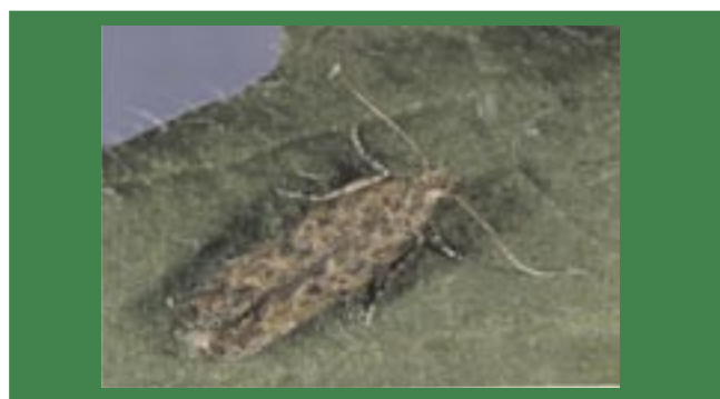
Fig.1. Adulto da traça-do-tomateiro.

O ciclo completo da traça-do-tomateiro dura de 26 a 30 dias. Os adultos são pequenas mariposas de coloração cinza-prateada, que medem cerca de 10 mm de comprimento (Figura 1). Durante o dia, os adultos escondem-se entre as folhas do tomateiro. Os adultos acasalam-se predominantemente ao amanhecer e ao entardecer. Cada fêmea pode depositar de 55 a 130 ovos durante 3 a 7 dias.