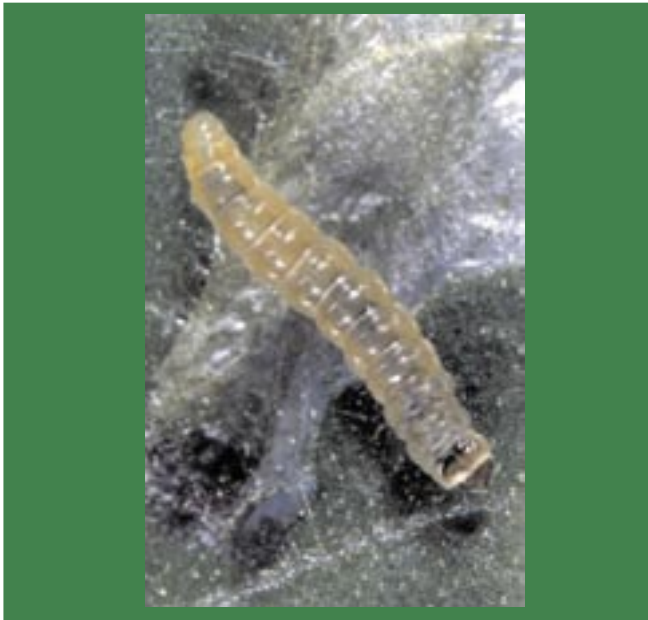
Fig. 3. Lagarta da traça-do-tomateiro.