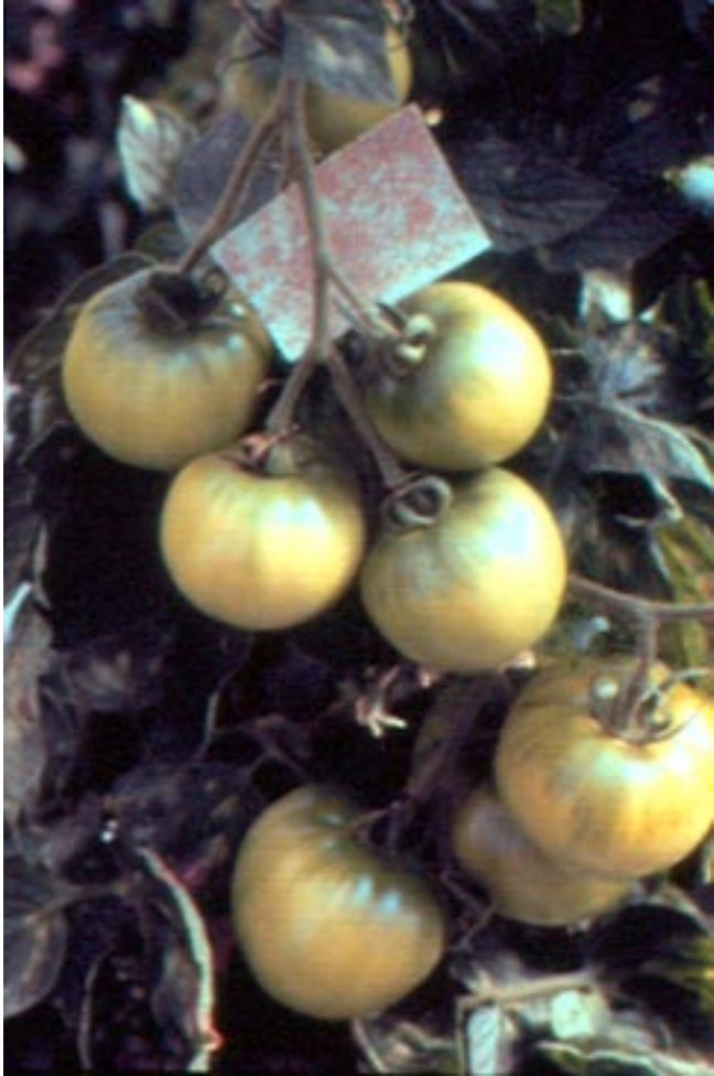
Fig. 7. Frutos de tomate com pedaço de cartela de ovos parasitados por Trichogramma pretiosum .

O controle biológico com T. pretiosum e B. thuringiensis tem assegurado controle eficiente e com menor custo (Figura 8). As taxas de parasitismo oscilam entre 20% e 45% e a redução dos gastos com a aplicação de inseticidas pode alcançar 80%. Assim, para o controle satisfatório da traça é fundamental empregar também as medidas recomendadas em práticas culturais. A principal dificuldade do controle biológico ainda é a falta de laboratórios capacitados para criar e vender o T. pretiosum . Todavia, já existem empresas especializadas que criam e comercializam este parasitóide, tais como: BUG AGENTES BIOLÓGICOS, em Piracicaba - SP e MEGABIO - Produtos Biológicos Ltda., em Uberlândia - MG.